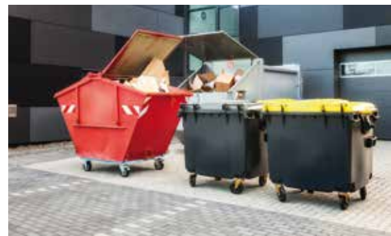
Gewerbeabfall Gewerbeabfallverordnung - dies gilt es zu beachten