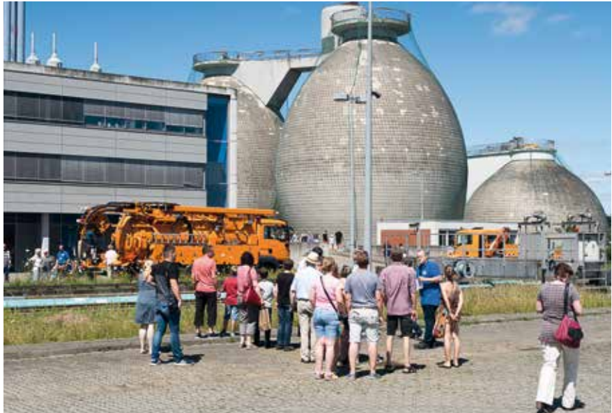
2.500 Besucher konnten beim Tag der offenen Tür zum 50-jährigen Jubiläum des Zentralklärwerkes Lübeck am 9. Juli 2017 moderne Stadtentwässerung erleben.

Tradition hat das Sommerfest im Lunapark im Hanseviertel. Dort sind wir regelmäßig mit einem Infostand vertreten und bieten neben Informationen, gelben Säcken und Spielen für Kinder auch immer ein offenes Ohr für Ihre Anregungen und Fragen.