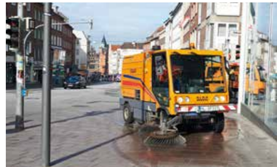
Straßenreinigungssatzung Gebührensenkungen sind zu erwarten