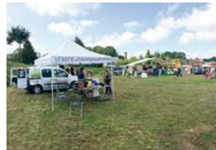
In Kronsforde am Kanal standen wir für Fragen und Diskussionen zur Verfügung.

Beim Kultursommertag am Kanal in Kronsforde waren wir in diesem Jahr bereits zum zweiten Mal vor Ort.