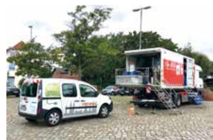
24-mal war in diesem Jahr das Schadstoffmobil und das Servicemobil der EBL in den Lübecker Stadtteilen vor Ort.

24-mal rückte das EBL-Service Mobil und das Schadstoffmobil in 2017 aus. Auch in 2018 sind wir wieder für Sie unterwegs. Die Termine finden Sie in diesem Heft auf Seite 5.