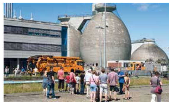
50 Jahre Zentralkläranlage Tag der offenen Tür im ZKW Lübeck