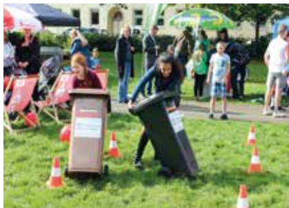
Viel Spaß hatten die Kinder im Lunapark bei Mülltonnenralley und Sortierspiel.